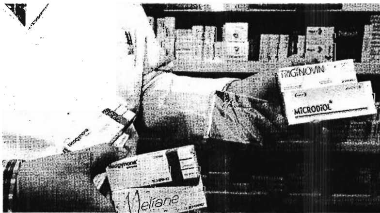
DIFERENTES MARCAS DE ANTICONCEPTIVOS ORALES.

graves inicialmente, pueden ocasionar serios problemas de infertilidad en un futuro. Por esta razón es necesario que los jóvenes conoz-